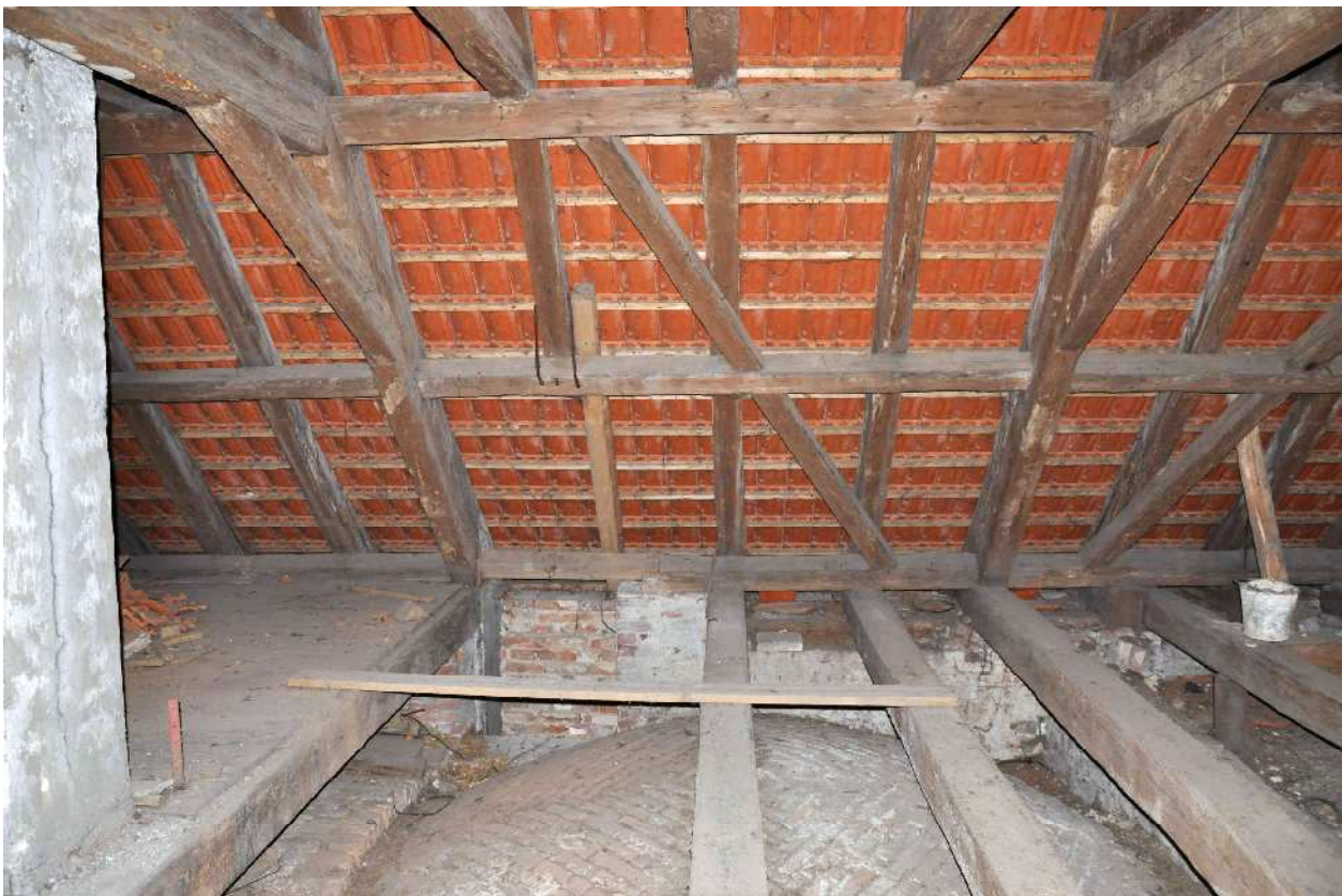
22,23 spodní část původní krokve jalové vazby vyříznuta, konec nad mezilehlou vaznicí ukotven k vaznici dvojicí kramlí, krokv nahrazena nově vloženou krátkou krokví vedle, uloženou na mezilehlou vaznici a novou část pozednice, původní vazný trám vyjmut v celé délce bez náhrady