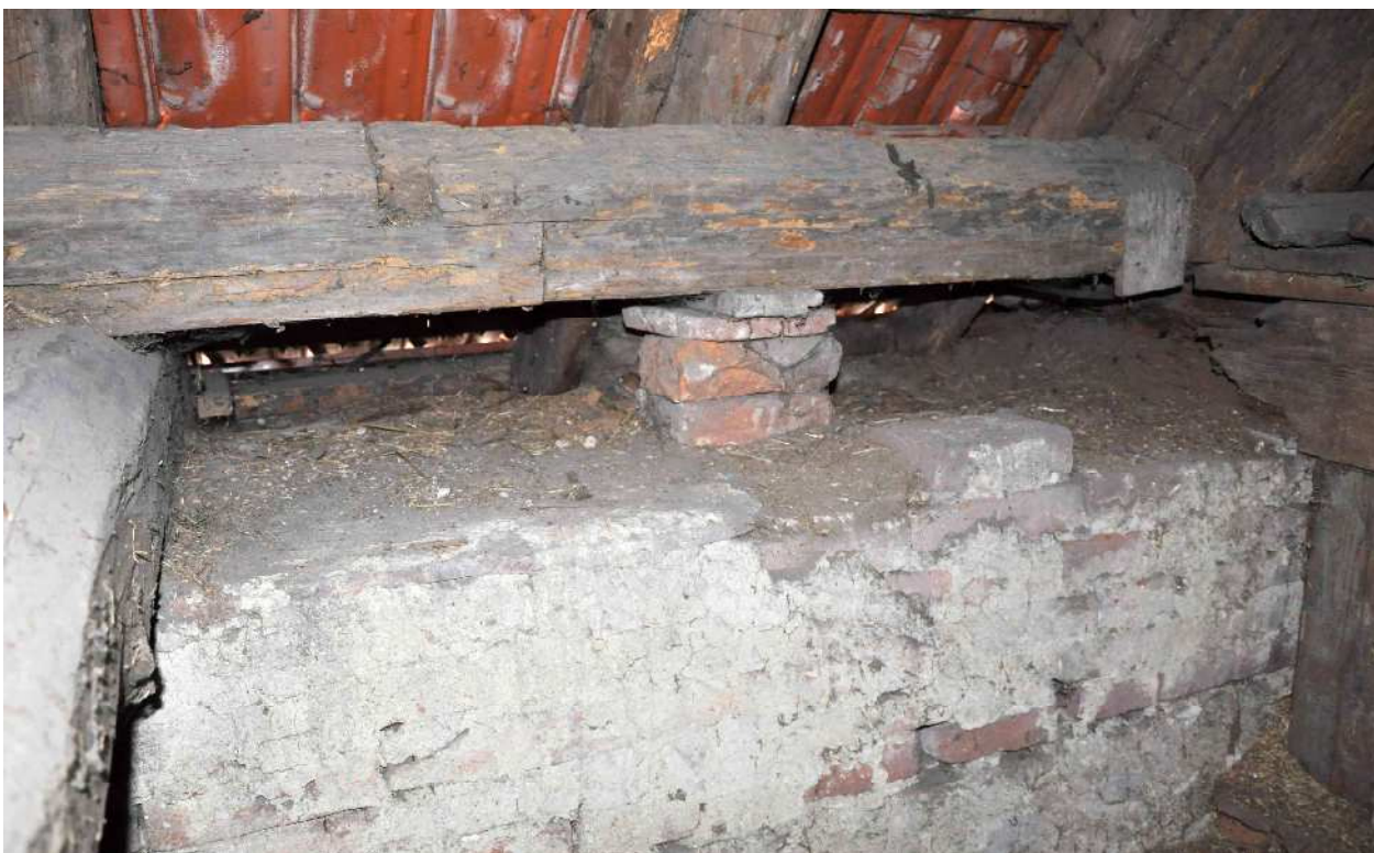
33 vazný trám jalové vazby vyříznut bez náhrady, ponechána pouze část zhlaví pod patou krokve, pozednice nad zhlavím vyříznuta a nahrazena vloženou protézou, napojenou na ponechanou původní pětibokou pozednicí ležatým plátem, styčník podezděn, pata krokve není dostatečně zajištěna proti vodorovnému posunu, předpoklad biotického narušení ponechané části zhlaví vazného trámu i paty krokve za pozednicí