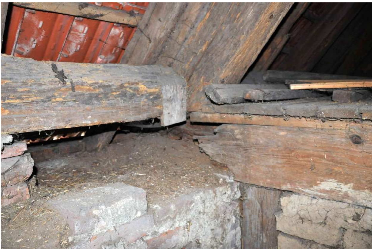
34 zhlaví vazného trámu plné vazby zcela rozloženo dřevokazným hmyzem, zhlaví podepřeno krátkým sloupkem o rub klenby a trám po délce podezděn vůči rubu klenby zdívkou z nepálených cihel, pata šikmého sloupku nastavena protézou opřenou do zcela rozloženého vazného trámu, protéza napojena na ponechanou část zazubeným čelním srazem