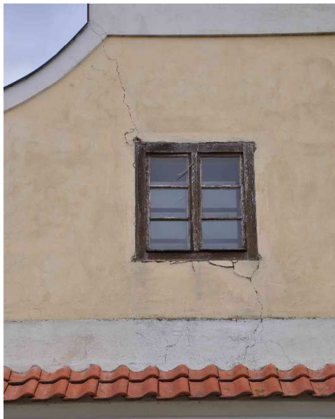
12 trhlinou a poklesem cihel narušený nadokenní záklenek na vnitřní straně severního okna v západní štítové stěně, trhliny na venkovním líci stěny okolo okna