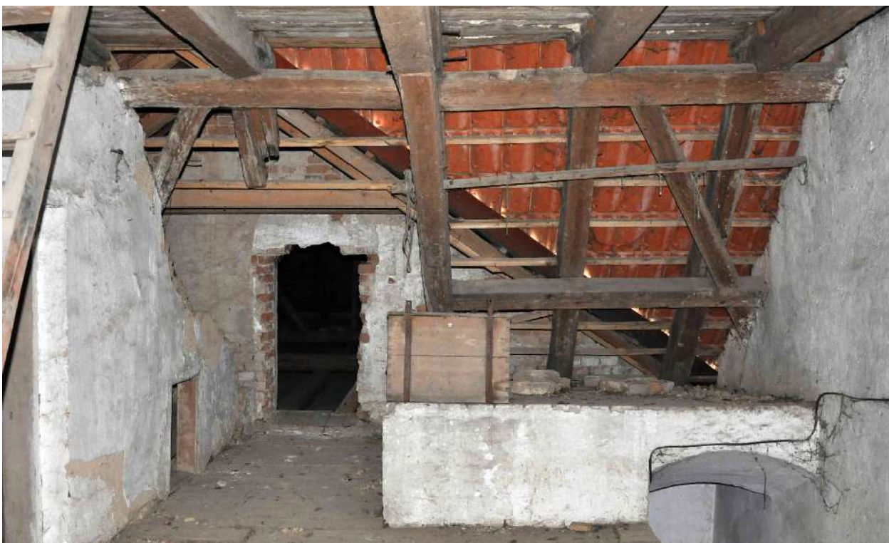
16,17,35 v rozsahu jednoho pole mezi plnými vazbami bez náhradního zajištění vyříznuta mezilehlá vaznice, ponechaný ondřejský kříž vlevo od plné vazby výrazně oslaben dlabem pro přeplátování vaznice, vyříznutá spodní část krokve jalové vazby bez náhradního zajištění, viditelný pokles vaznic u plné vazby, nadpraží průrazu stěnou na půdu nad kúlňou není zajištěno překladem