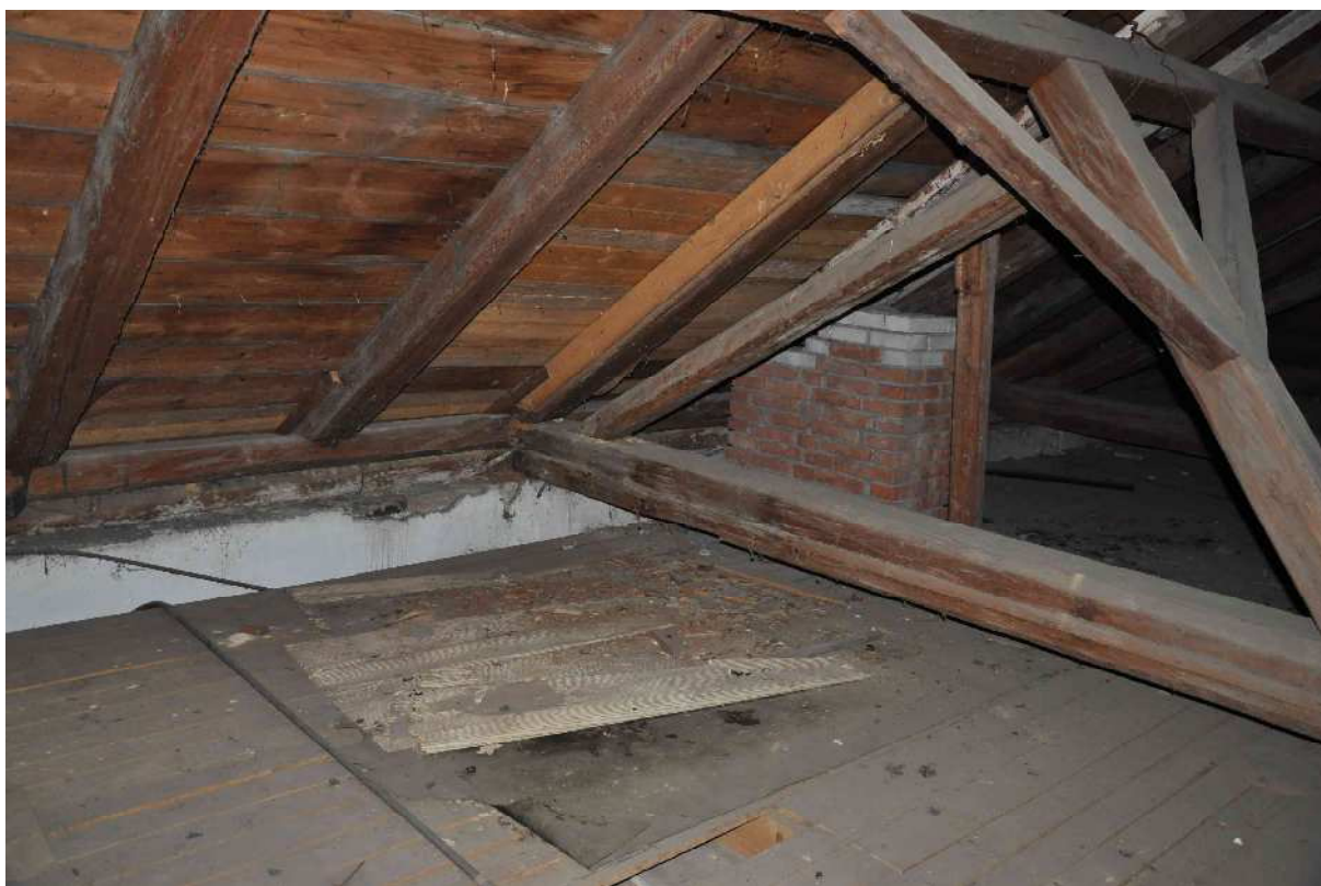
3 výrazné biotické narušení zhlaví vazného trámu, paty krokve a pozednice dřevokazným hmyzem ( Anobiade ) a dřevokaznou houbou ( Coniophora ), zhlaví vazného trámu viditelně pokleslé, deformace pro latování srovnána bočními příložkami přibíjenými ke krokví hřebíky