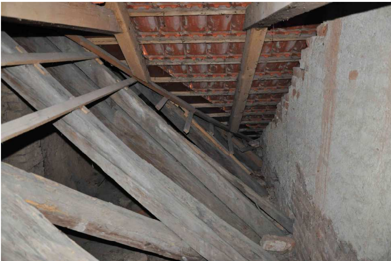
15 nově vložené krokve v místě napojení krovu čeledníku na krov kúlňy (osazené patrně při pokládce stávající krytiny), krokve v patě pouze lípnuty na lať, přibíto šikmo přes laťování, lať neprůběžná, nastavovaná na sraz, řemeslně velmi nekvalitní, nedostatečně zajištěný spoj