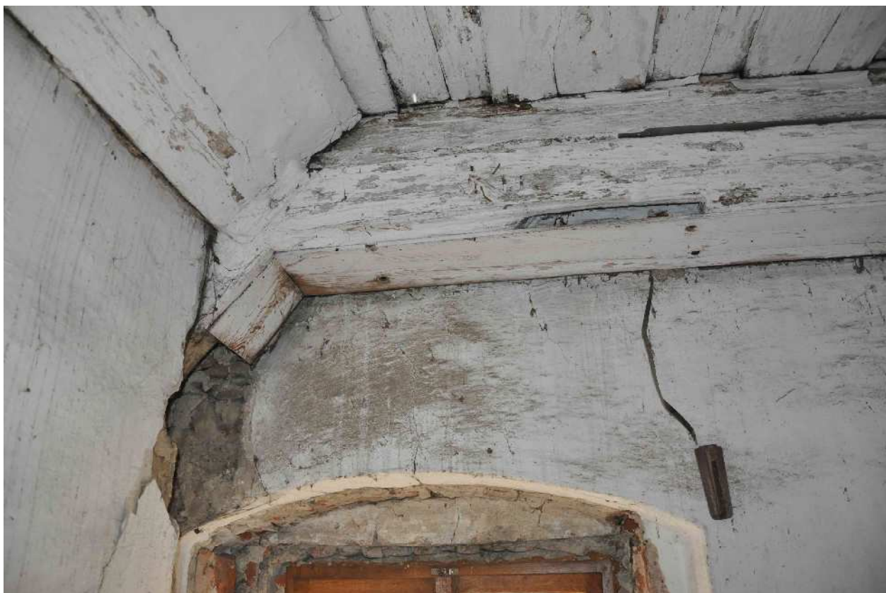
10 vyjmutý pásek plné vazby u západní štítové stěny, vazba bez pásku není dostatečně ztužena, tvarově nestabilní nestabilní