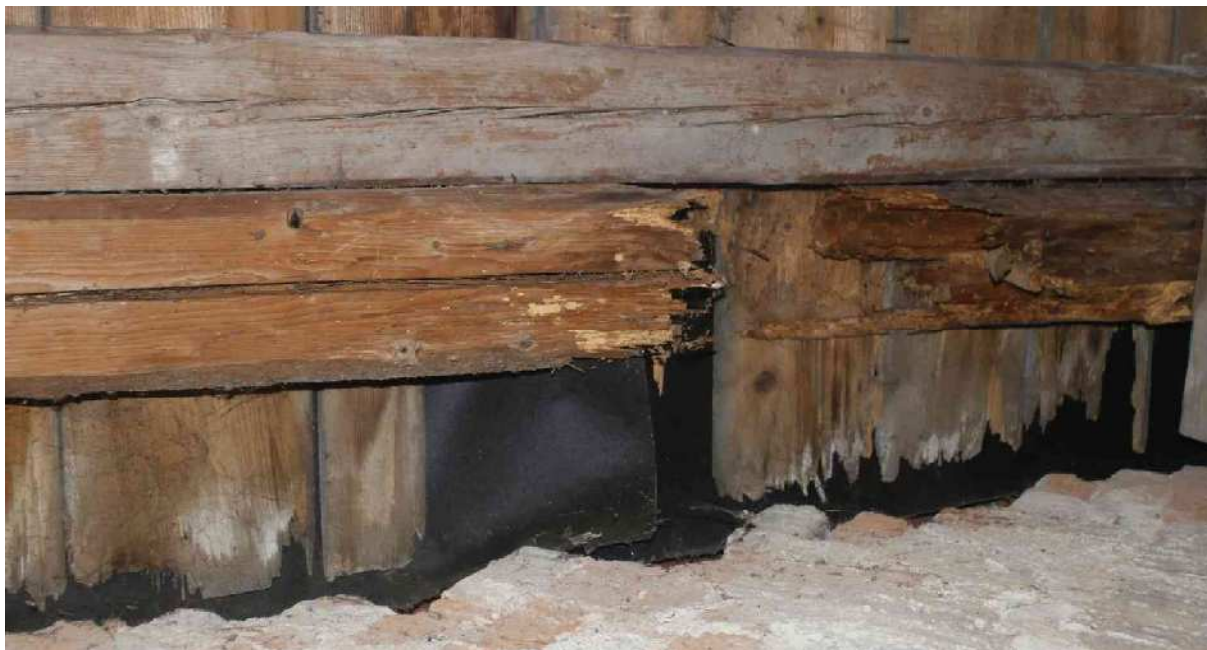
1 celkový rozpad dřeva původní krokve v úseku nad vaznicí dřevokaznou houbou ( Coniophora ), vedle původní krokve osazena v celé délce nová krokev, ve zhlaví sepnuta s protilehlou krokví kramlí a krátkou kleštinou z prkna, přibitou hřebíky